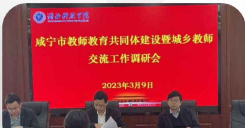
省厅领导调研教师教育综合改革实验区建设