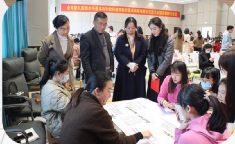
参加咸宁市主题教研活动