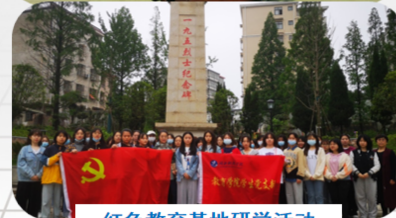
红色教育基地研学活动