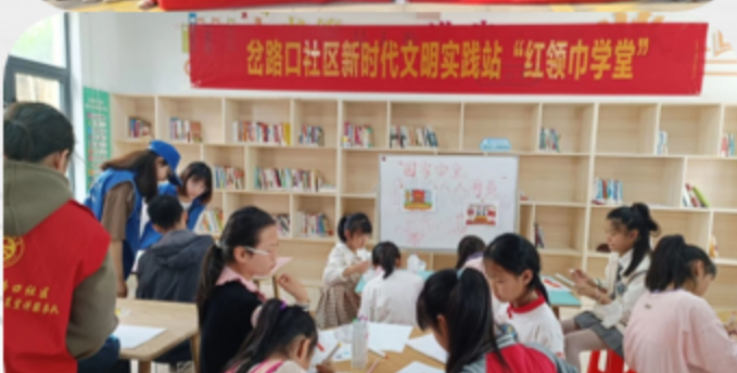
青辅学堂志愿服务—新宁小区活动