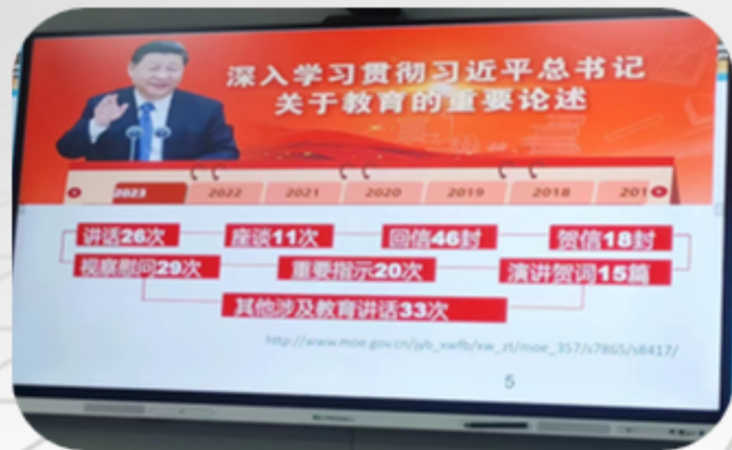
邀请专家做师德讲座