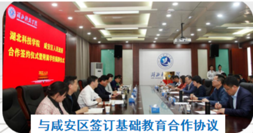
与咸安区签订基础教育合作协议